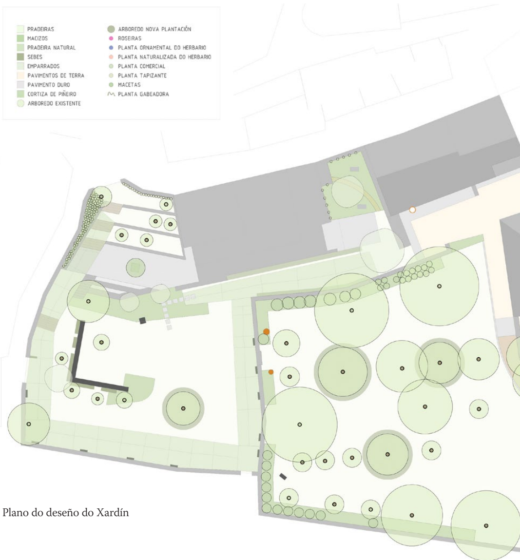
Plano do deseño do Xardín