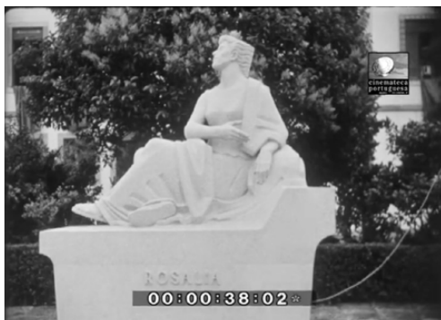
Imaxe 3. A estatua de Rosalía.