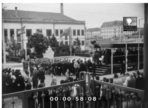
Imaxe 6. O xardín, a tribuna e o público.