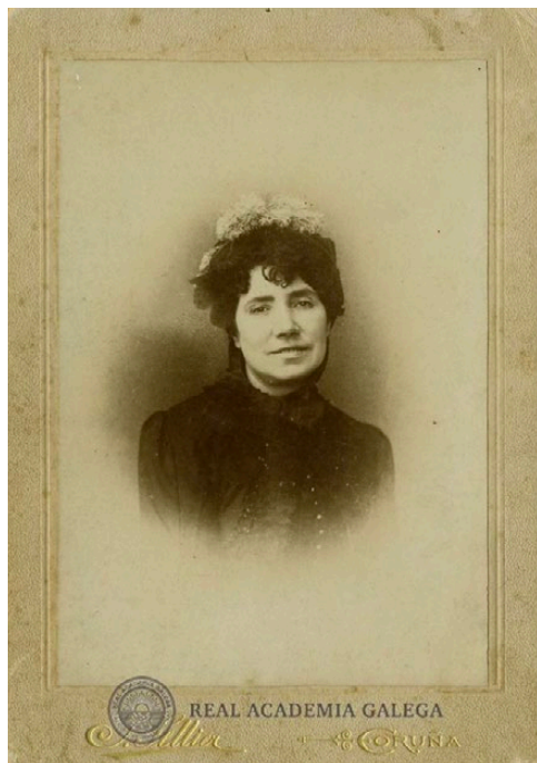
Imaxe 11. Retrato de Rosalía de Castro.