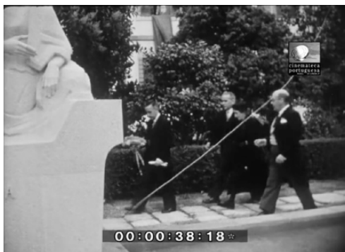
Imaxe 4. A comitiva dirixese a depositar o ramo.