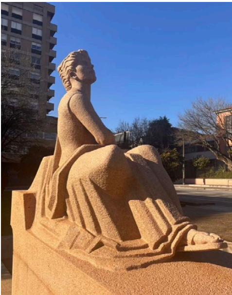
Imaxe 9. A estatua vista dende un dos lados. Fotografía de 27 de decembro de 2024.