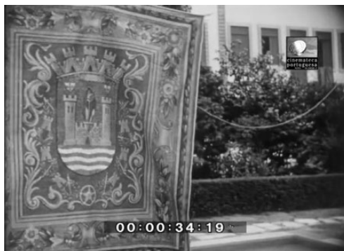
Imaxe 2. Tapiz co escudo da cidade.