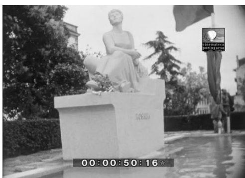
Imaxe 5. A estatua de Rosalía vista de fronte.