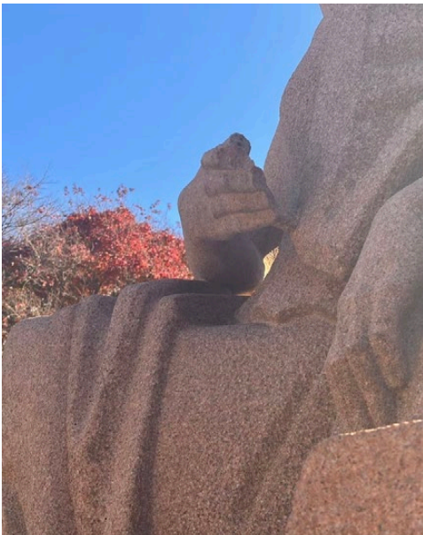
Imaxe 16. Detalle da man da estatua. Fotografía de 27 de decembro de 2024.