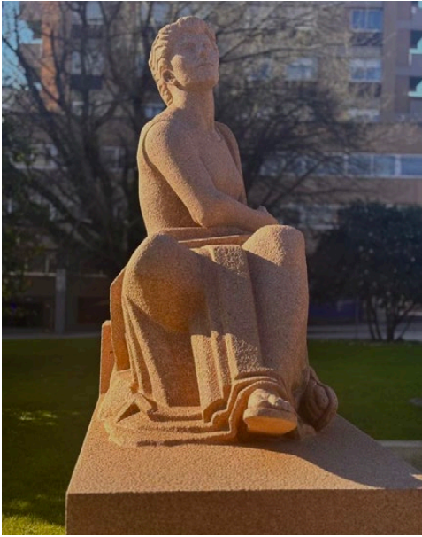
Imaxe 7. A estatua vista de fronte. Fotografía de 27 de decembro de 2024