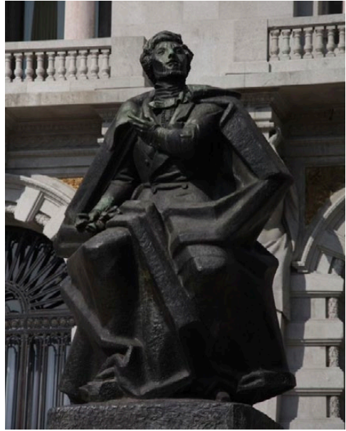
Imaxe 8. A estatua de Almeida Garret.