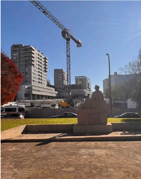
Imaxe 14. A estatua vista dende o estanque. Fotografía de 27 de decembro de 2024.