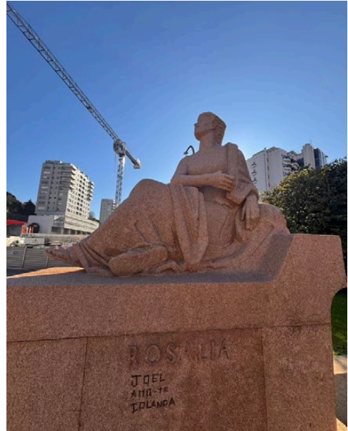
Imaxe 15. A estatua vista dende o estanque. Fotografía de 27 de decembro de 2024.