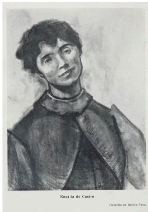
Imaxe 12. Debuxo de Salvador Barata Feyo.