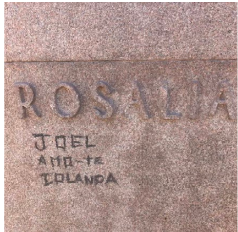
Imaxe 17. Detalle da inscrición e do grafiti. Fotografía de 27 de decembro de 2024.